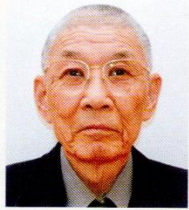
国際ロータリー第2550地区 宇都宮陽東ロータリークラブ