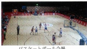
バスケットボール会場