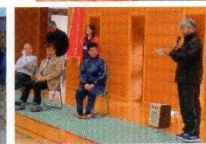
薄井選手に挑戦する県障害福祉課長