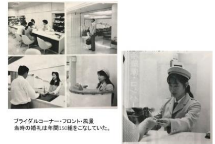
プライダルコーナー・フロント・風景 当時の婚礼は年間150組をこなしていた。

平成元年9月 本館増築工事完成。全館リニューアルオープン延床面積 14,310㎡・総宿泊室数 230室北関東でも最大規模となる。